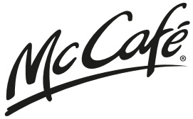
TABELA WARTOŚCI ODŻYWCZYCH MCDONALD'S®