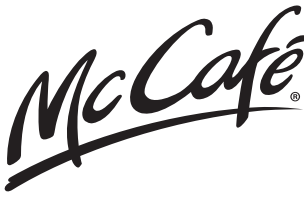
TABELA WARTOŚCI ODŻYWCZYCH Mccafé®